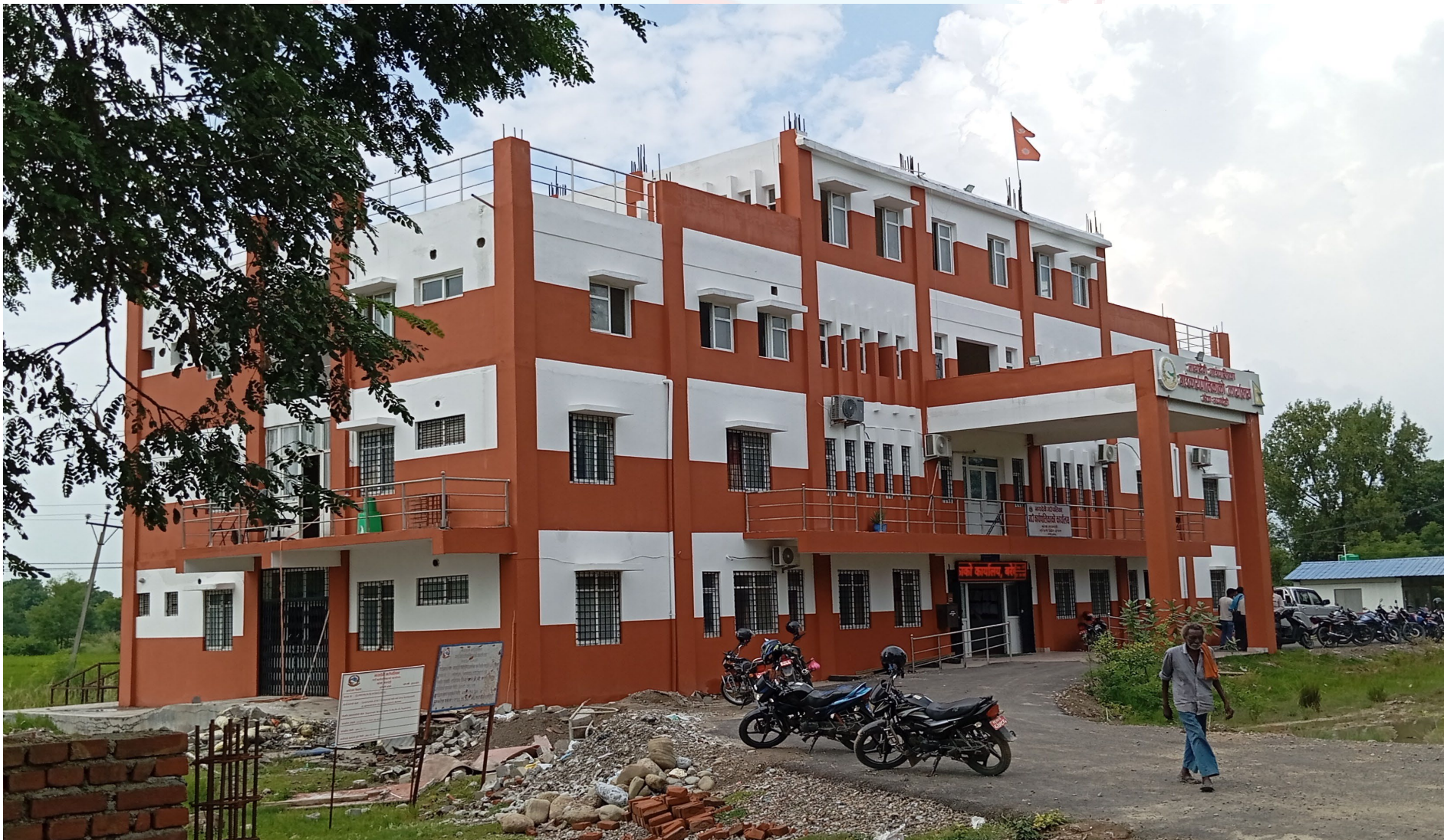
गाउँपालिकाको प्रशासकीय भवन