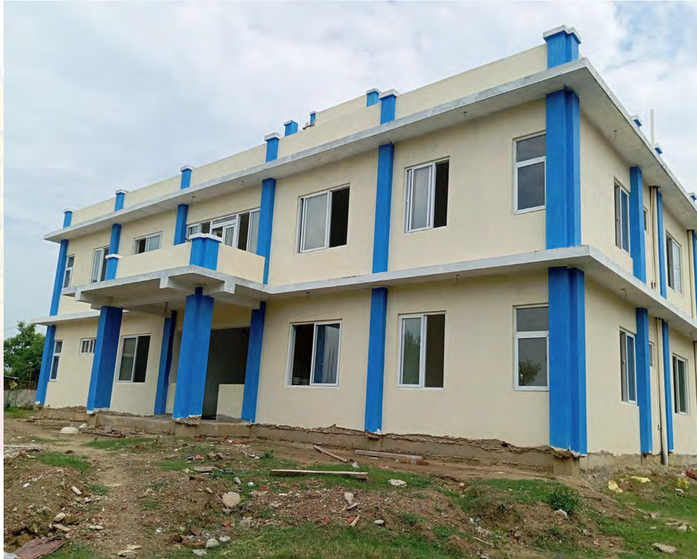
अस्पताल कर्मचारी आवास लुम्बिनी प्रदेश, नेपाल।