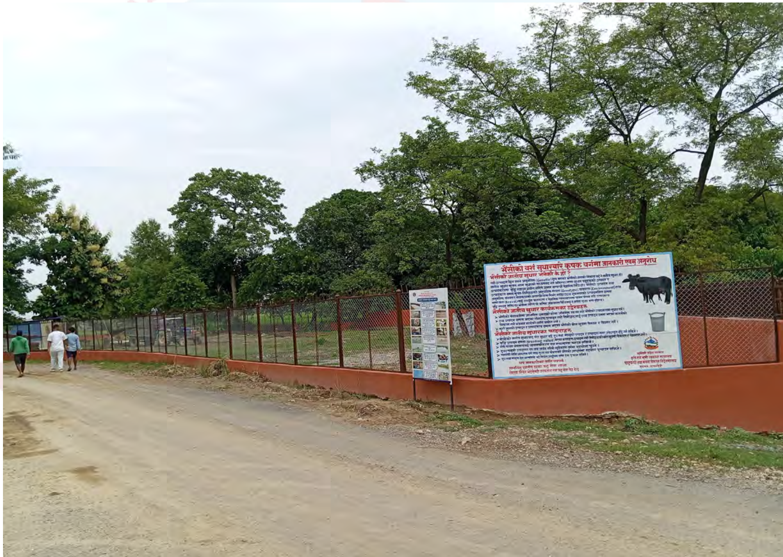
निर्माणधीन शाहिद पार्क