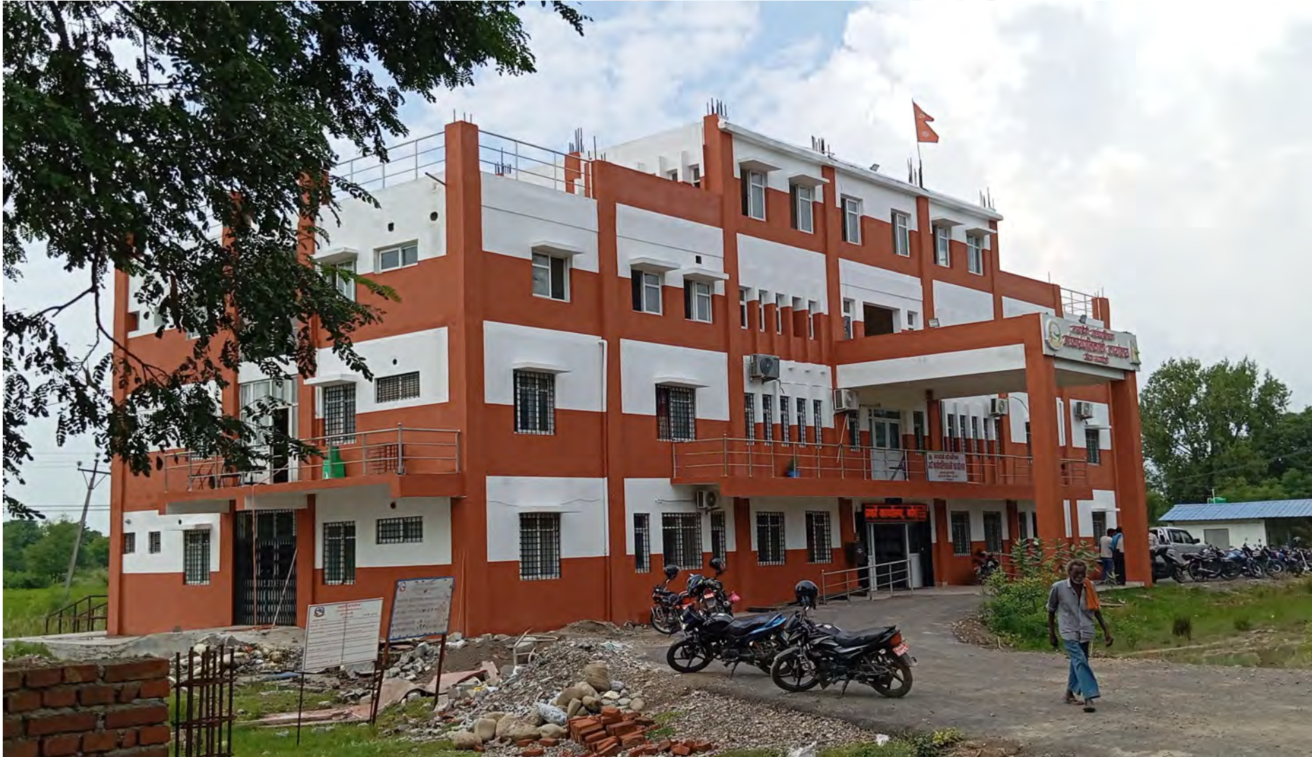
गाउँपालिकाको प्रशासकीय भवन